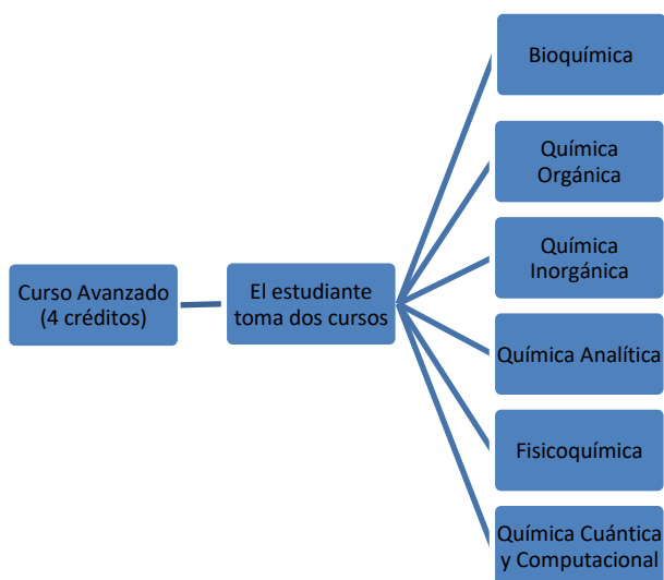
Figura 1. Cursos de fundamentación ofrecidos por el Departamento de Química.

El Taller de Investigación y el Laboratorio de Posgrado se ofrecerán semestralmente y los cursos de fundamentación se alternarán anualmente. La calificación en todos los casos será numérica.